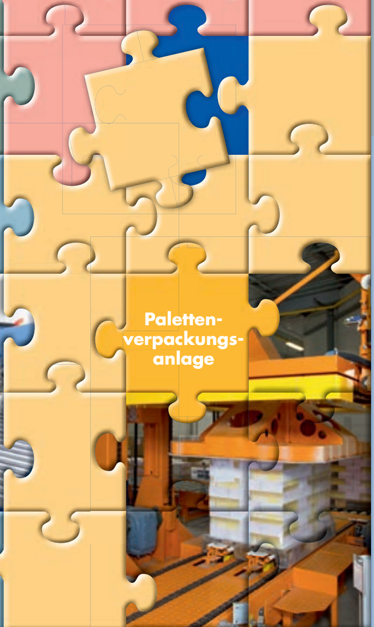
Paletten- verpackungs- anlage