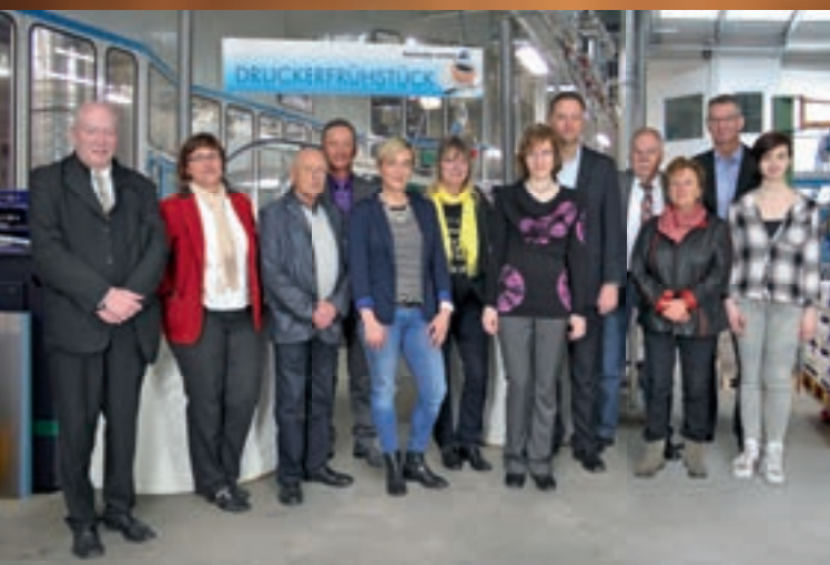
Team der IHK Dresden, IHK zu Leipzig, Endriß & Schnitzer Werbe- und Verlags-GmbH, FRIEBEL Werbeagentur und Verlag GmbH und Druckerei Vettters

Nach einem gemeinsamen „Druckerfrühstück“ konnten die Damen und Herren unseren Neubau besichtigen, bekamen Einblick in die diversen Produktionsbereiche und Fertigungsmöglichkeiten unseres Hauses. Wir führten viele interessante Gespräche und entwickelten Ideen für die weitere Zusammenarbeit.