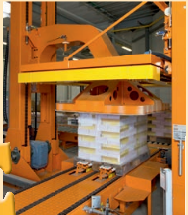
Unsere Verpackungsanlage MSK Multitech