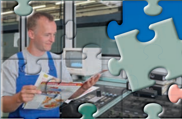
SUPman Rollendruck- maschine