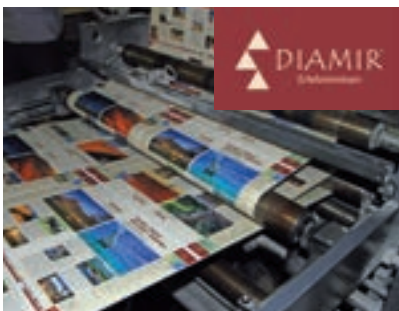
Druckfrisch in der Maschine: der DIAMIR-Reisekatalog für 2017 während der Fertigung