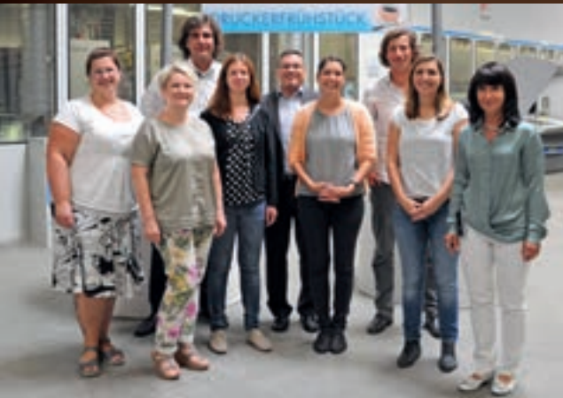
Das Team der Stadtwerke Leipzig GmbH, Diemar, Jung & Zapfe Werbeagentur GmbH, Trurnit Publishers GmbH sowie Druckerei Vettters