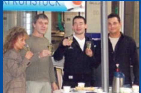
Lausitzer Druck- und Verlagshaus GmbH