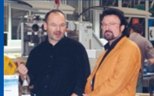
aperçu Verlagsgesellschaft mbH