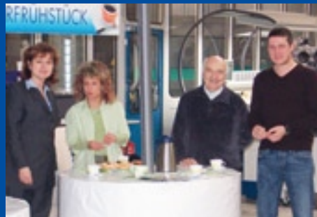
Progress Media Verlags- und Werbeagentur GmbH