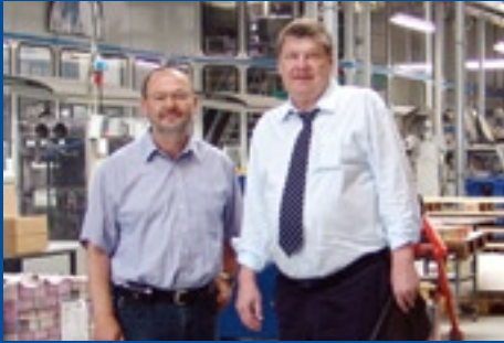
Dieter Jesse - Bürgermeister aus Radeburg