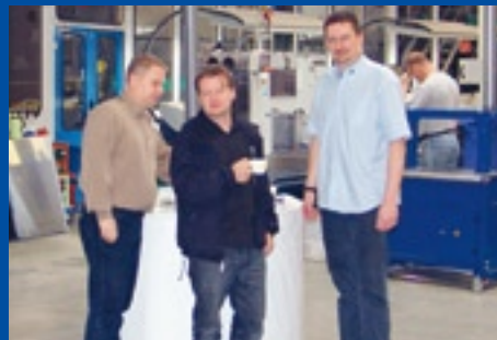
Markus Wolf Verlag