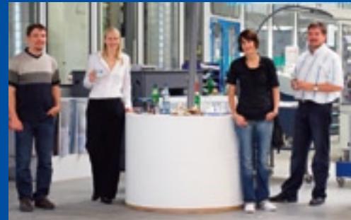
B+S Mailmanagement GmbH & Co. KG myToys