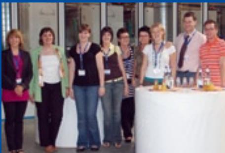
WAREMA Renkhoff GmbH