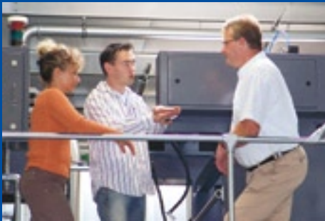
FINANCIAL TIMES DEUTSCHLAND GmbH & Co. KG