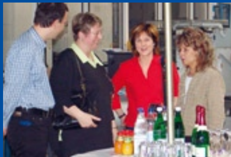
PDS-Fraktion im Sächsischen Landtag