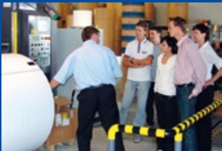
Pako - NonFood Warenhandelsgesellschaft mbH