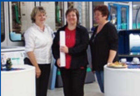
Mammut Verlag Leipzig