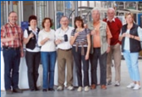
Beisner Druck GmbH & Co. KG