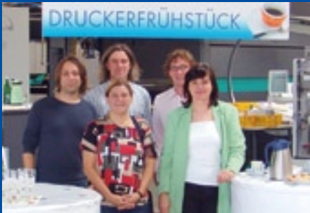
DRESDNER Kulturmagazin Medien VerlagsGmbH