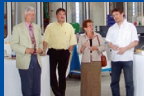
RKW Sachsen GmbH