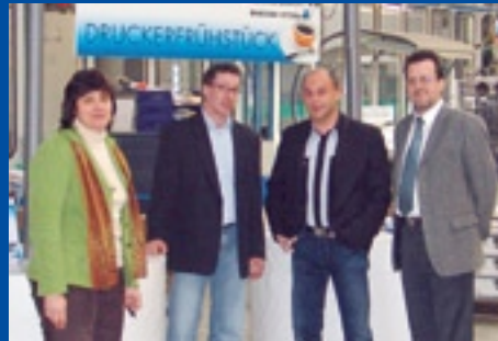
Druckservice und Verlag Burkhardt