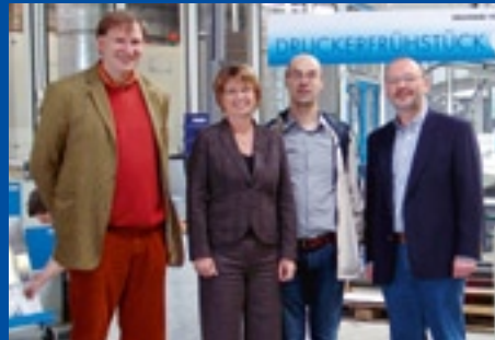
Bündnis 90 / Die Grünen Mitglieder des Bundes- und Landtages