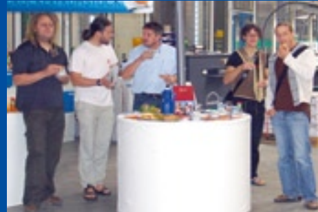
Diamir Erlebnisreisen GmbH