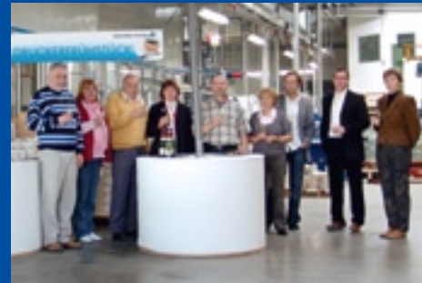
Endriss & Schnitzer Werbe- & Verlagsgesellschaft mbH